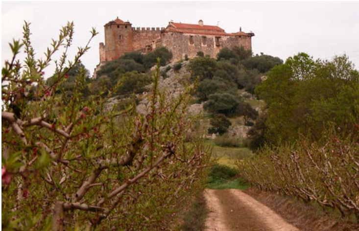
Pie de foto Caption

Estas rutas permiten conocer mejor la realidad agrícola, como se realizó la concentración parcelaria heredada del proceso de colonización y arquitecturas