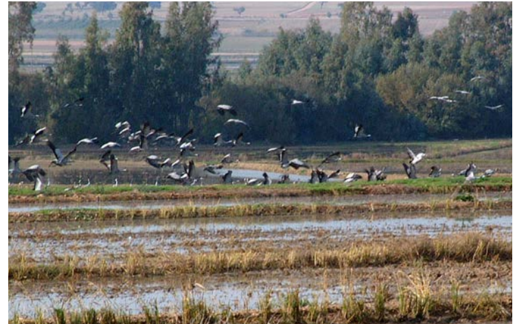
Pie de foto Caption

Tramo 2. Ruta Circular. Con esta actividad pretendemos dar a conocer al visitante la comarca de las Vegas Altas del Guadiana donde se concentra la actividad hortofrutícolas y la mayor parte de la extensión frutal. Otra de las singularidades de esta zona es que la mayoría de los pueblos pertenecen al Plan Badajoz, a excepción de Rena y Villar de Rena, el resto son jóvenes pueblos de colonización caracterizados por desarrollo urbanístico regular e identitario. Además, esta ruta recorre la Zona de Especial Protección de Aves de "Los Arrozales-Palazuelos", caracterizada por sus poblaciones migratorias de grullas y otras especies ornitológicas de gran interés.